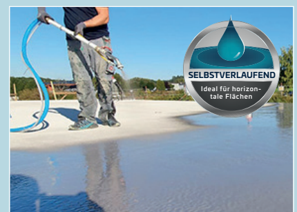
So einfach war's noch nie: Abdichten mit RD Flow

Die als Produktbeschreibung gemachten Angaben erfolgen aufgrund unserer Erfahrungen nach bestem Wissen, jedoch unverbindlich. Sie sind auf die jeweiligen Bauobjekte, Verwendungszwecke und die besonderen örtlichen Beanspruchungen abzustimmen. Dies vorausgesetzt, haften wir für die Richtigkeit dieser Angaben im Rahmen unserer Verkaufs-, Lieferungs- und Zahlungsbedingungen. Von den Angaben im Lieferprogramm abweichende Empfehlungen unserer Mitarbeiter sind für uns nur verbindlich, wenn sie schriftlich bestätigt werden. Zur Erzielung optimaler Ergebnisse empfehlen wir immer eine baustellenspezifische Probeverarbeitung. In jedem Fall sind die allgemein anerkannten Regeln der Technik einzuhalten. Aktuelle technische Merkblätter finden Sie unter: www.botament.com .